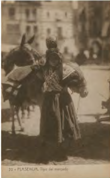
ES.10037.ADPCC / 04.02.51. // POS 00393.