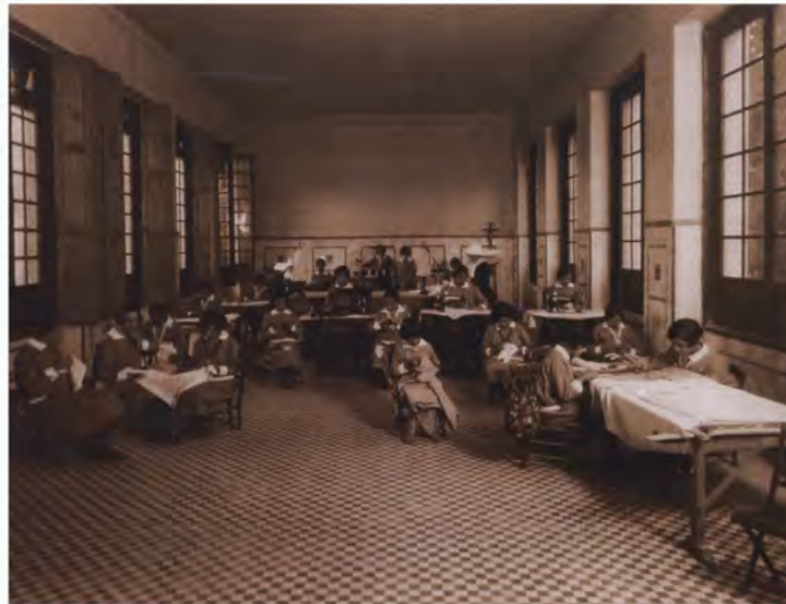
ES.10037.ADPCC / 04.02.50.05. // FOT 00401

El 8 de marzo es el Día Internacional de la Mujer. En 1910 se celebró en Copenhague la II Conferencia Internacional de Mujeres Socialistas. Allí se propuso conmemorar el Día Internacional de la Mujer Trabajadora, que se celebró por primera vez el 19 de marzo del año siguiente en unos pocos países europeos. Si bien en Occidente la mujer ha comenzado el camino hacia la igualdad, aún no conseguida del todo, en muchos países la vida de las mujeres continúa como hace cien años: menos acceso a la educación y a los estudios superiores y, por tanto, a puestos relevantes en la sociedad; salario menor para igual trabajo; explotación sexual; rituales trasnochados (la mutilación genital femenina aún se practica en muchos países); violaciones impunes...