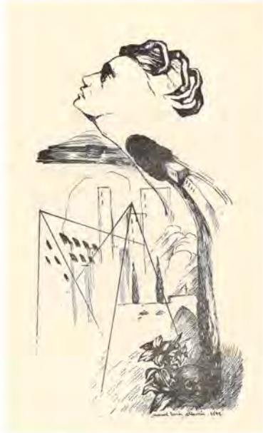
Ilustración de Manuel Terrón para Ausencia de mis manos (1949). BEX 333

Creo que el poeta o el escritor se compromete porque desnuda las palabras, las hace adquirir vida propia, les quita la frialdad virgen de la lógica. El poeta hace que las palabras se hagan anárquicas contra tanta mentira vestida de verdad. En mi compromiso como poeta, las palabras están unidas a la Poesía, que, como notaria de la luz , ilumina las actas de la vida concienciando a los hombres. Yo estoy comprometido con el hombre y mi poesía ha bajado a la tierra que el hombre pisa.