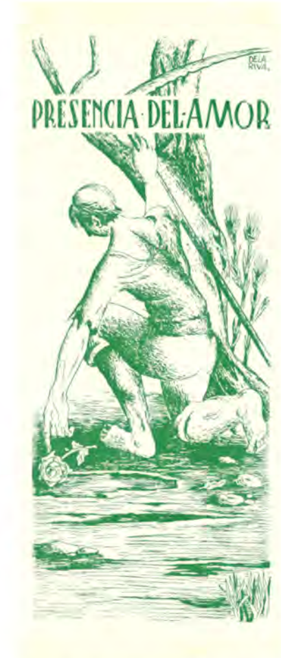
Ilustración de De la Riva para Presencia mía (1955). BEX 1603

Primer poema del libro Ausencia de mis manos (1949).